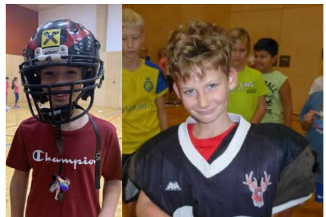
Die richtige Ausrüstung ist entscheidend.